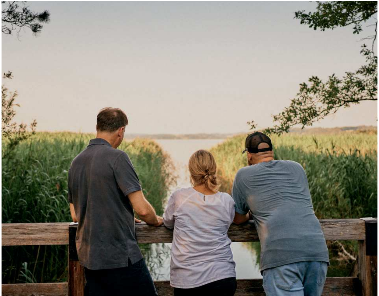
Der oberbayerische Simssee nahe Rosenheim hat der Handweberei ihren Namen gegeben.