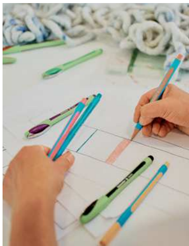
Bevor ein Teppich in Produktion geht, werden die Vorstellungen in einem Entwurf visualisiert.

Für manche ist ein Teppich nur ein Alltagsgegenstand. Für Familie Licht verbindet er traditionelle Handwerkskunst mit modernem Lifestyle.